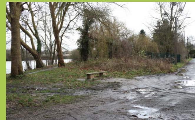
Place du Valhermeil avant