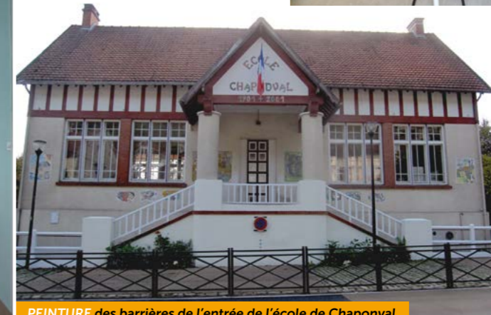
PEINTURE des barrières de l'entrée de l'école de Chaponval