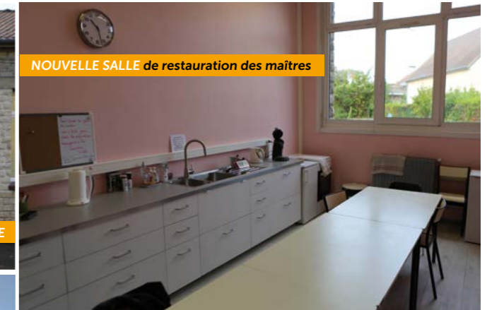
NOUVELLE SALLE de restauration des maîtres