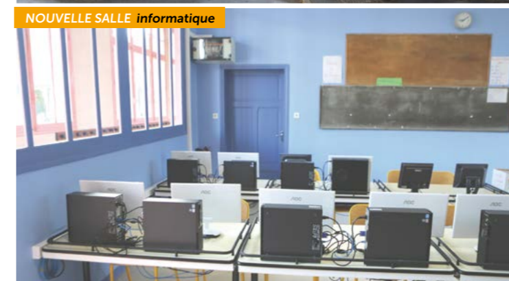
NOUVELLE SALLE informatique