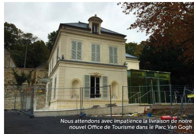
Nous attendons avec impatience la livraison de notre nouvel Office de Tourisme dans le Parc Van Gogh

Un comité de pilotage tourisme composé des acteurs culturels de la ville vient d'être mis en place afin de travailler ensemble autour d'un projet touristique pertinent et innovant, avec le concours du comité départemental du tourisme et du comité régional Ile-de-France du Tourisme.