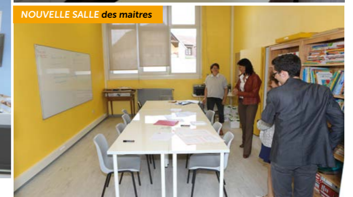
NOUVELLE SALLE des maîtres