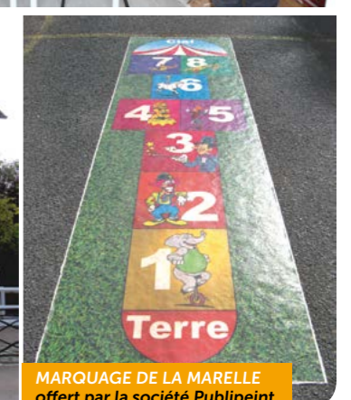
MARQUAGE DE LA MARELLE offert par la société Publipeint