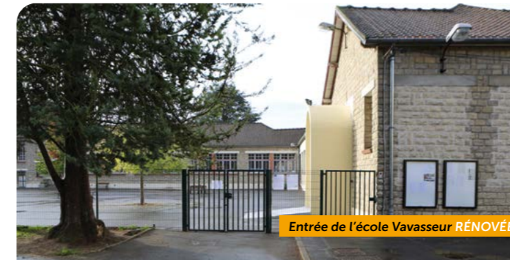
Entrée de l'école Vavasseur RÉNOVÉE

Entretien des cours. Rénovation du bâtiment annexe du centre de loisirs.