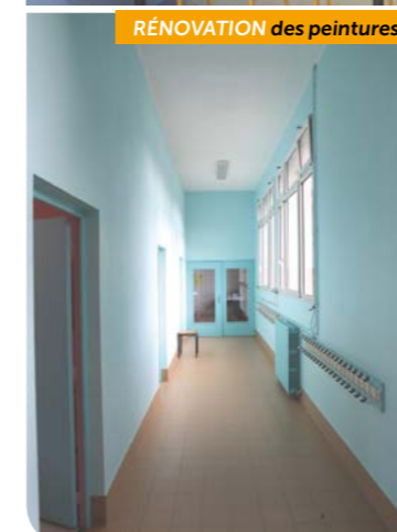
RÉNOVATION des peintures