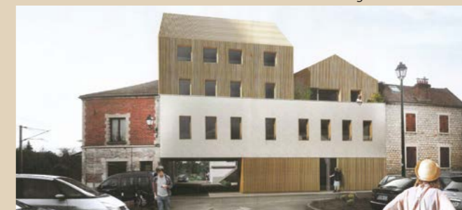
Projet architectural du 23 rue du Pois rejeté