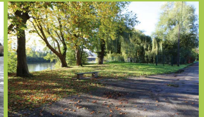
Place du Valhermeil après